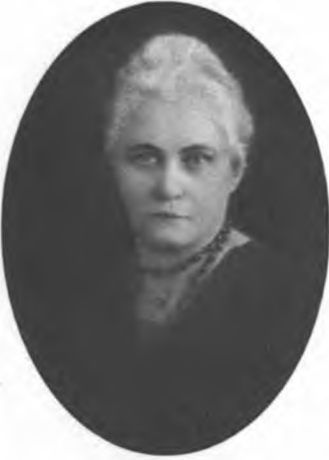
Моя красавица бабушка.