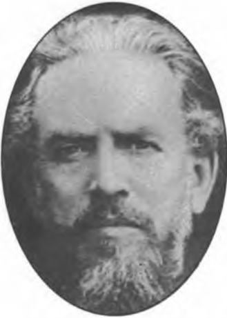
Мой любимый дедушка.