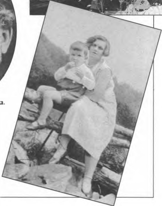
Мама и я. Это мы в Америке.