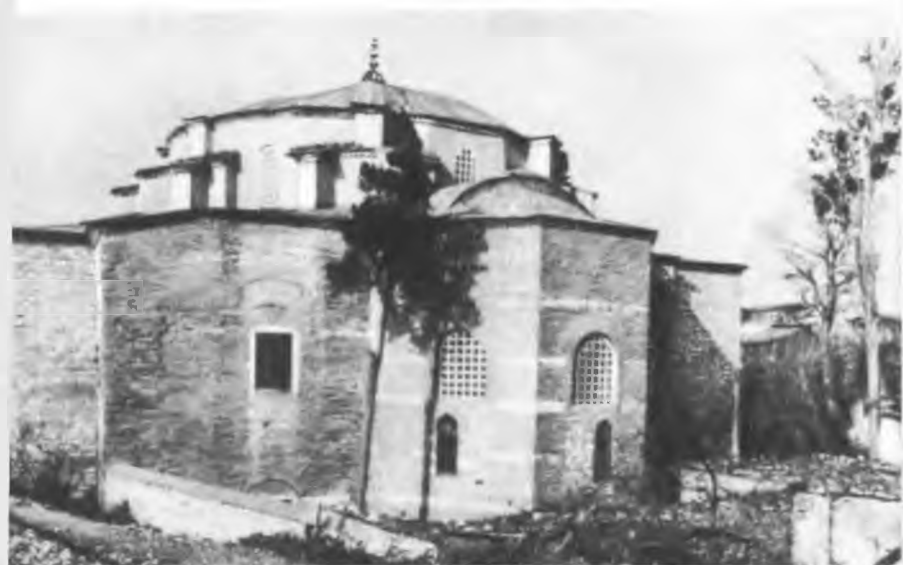
Церковь св. Сергия и Вахка (Кючук Айя Софья джами) (VI в.)