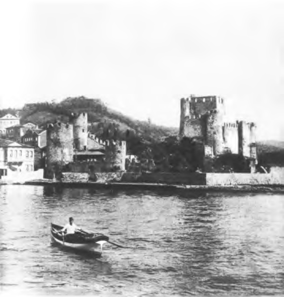
Крепость Anadolu Хисар (фото начала нашего века)