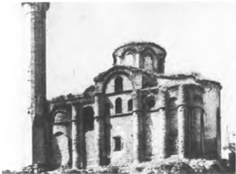
Мирелеон (Будрум джами) (X в.)