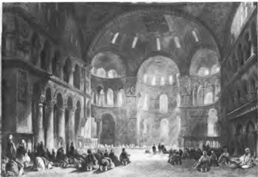
Внутренний вид мечети Айя Софья Невольничий рынок