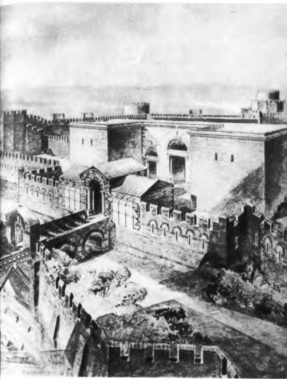
«Золотые ворота» в Константинополе (реконструкция)