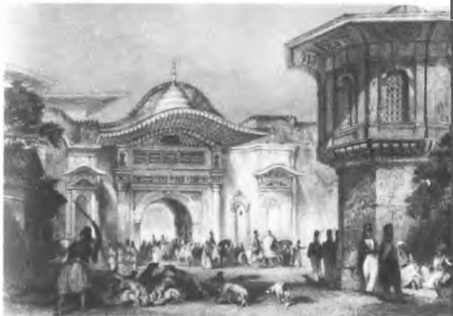
У входа в здание Высокой Порты Капалы Чаршы