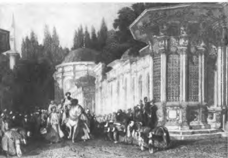
Торжественный выезд султана Семибашенный замок (Едикуле)