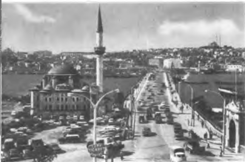
Современный Стамбул. Мост Ататюрка через Золотой Рог