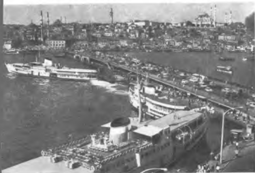
Современный Стамбул. Галатский мост через Золотой Рог и панорама старой части города