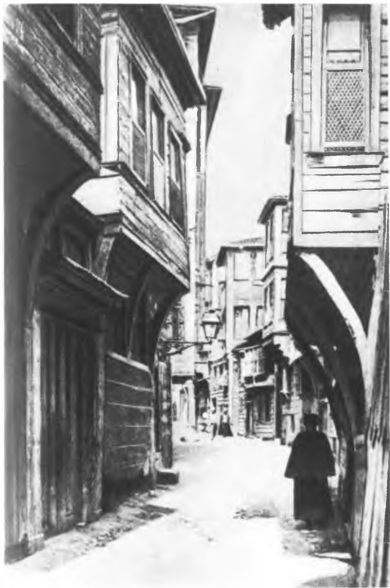
Улица в турецком квартале (фото начала нашего века)