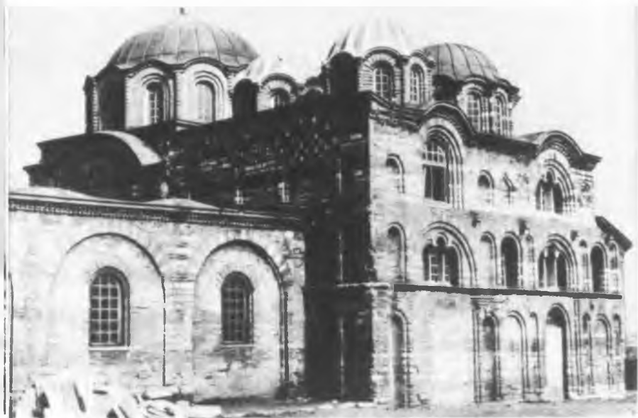
Церковь Паммакаристи (Божьей матери всеблаженнейшей) (Фетхие джами) (XII—XIV вв.)