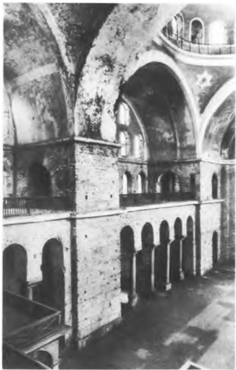
Церковь св. Ирины (внутренний вид)