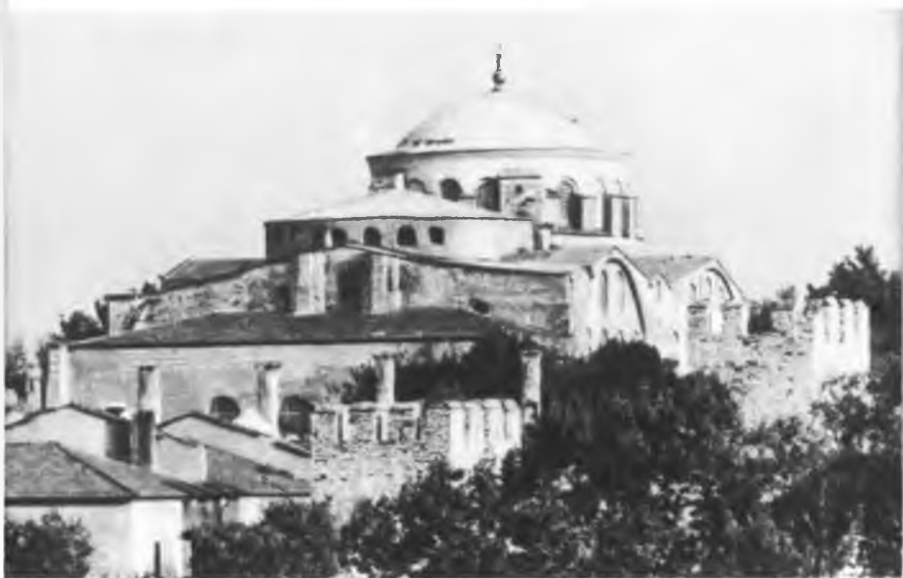
Церковь св. Ирины (VI—VIII вв.)