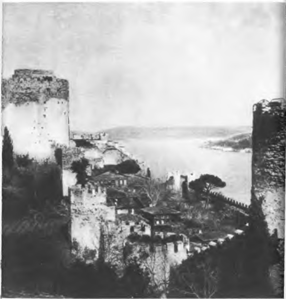
Крепость Румели Хисар (фото начала нашего века)