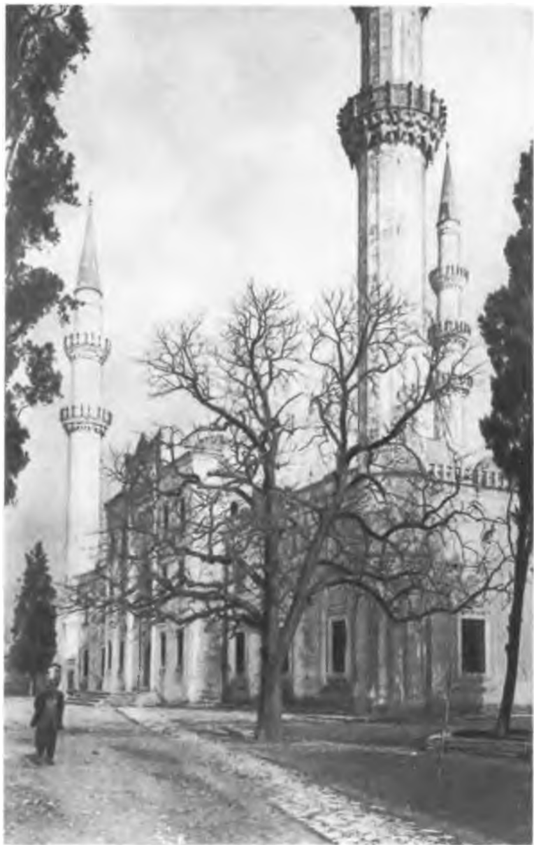
Мечеть Сулеймание (середина XVI в.)