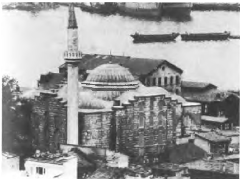
Церковь св. Феодосия (Гюль джами) (X—XI вв.)