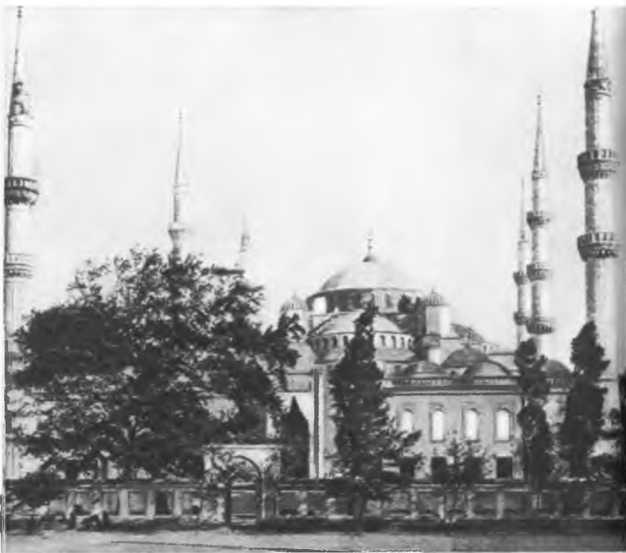
Мечеть Султан Ахмед (начало XVII в.) (фото начала нашего века)