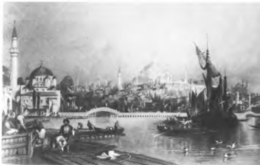
Панорама Стамбула (вид со стороны Золотого Рога)