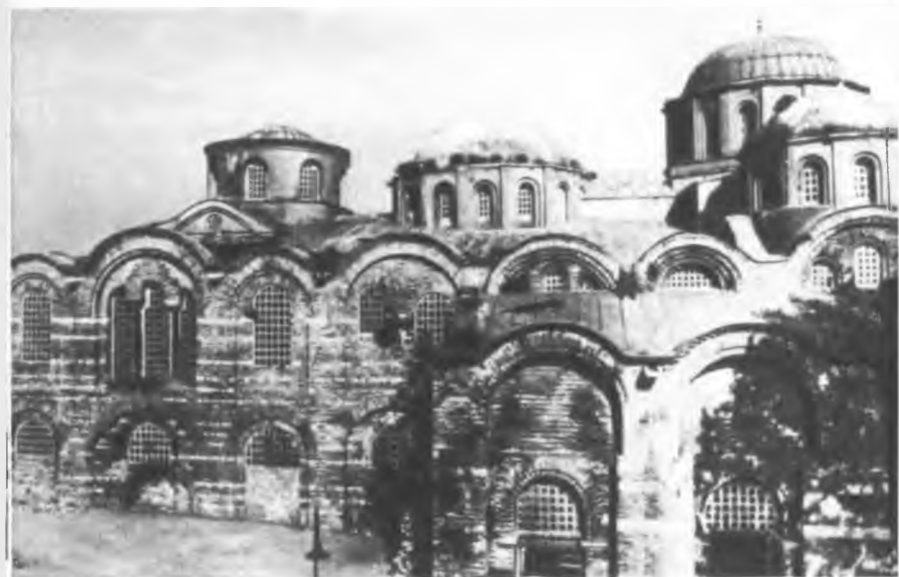
Церковь Пантократора (Вседержителя) (Зейрек джами) (VII в.)