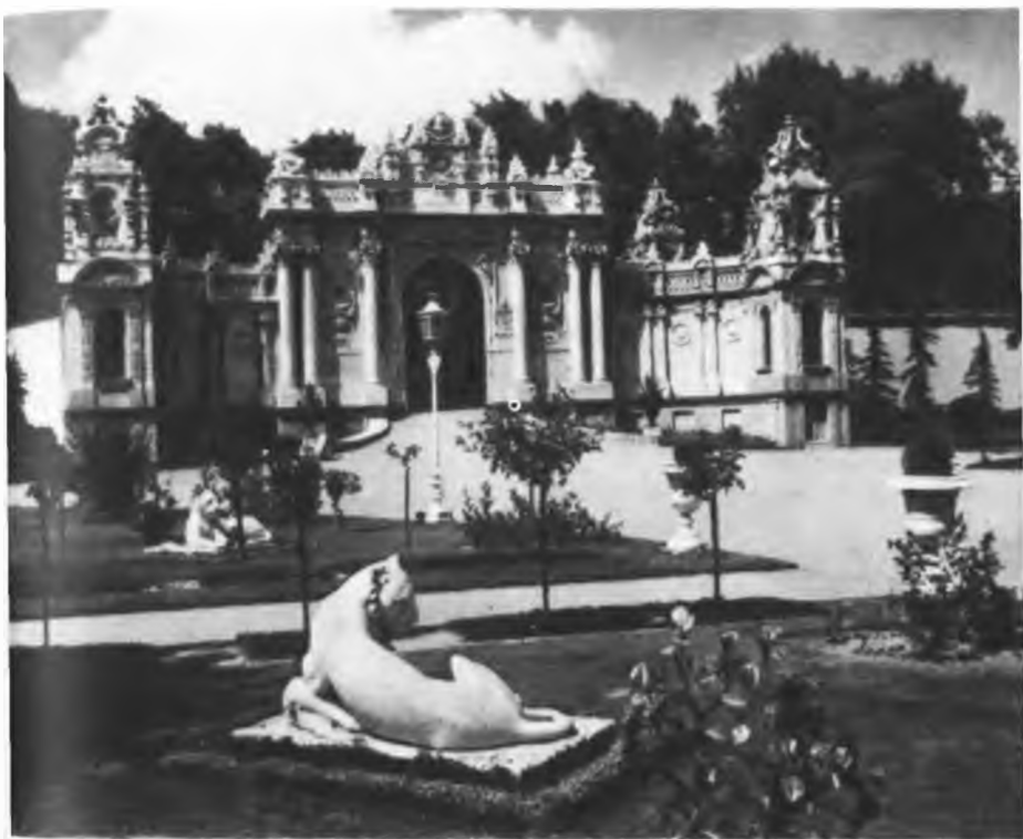
Парадные ворота дворца-музея Долма Бахче