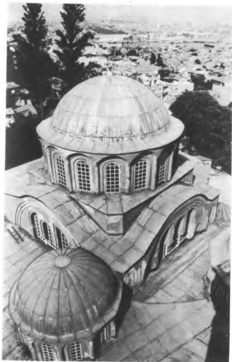
Церковь Хора (Бахрие джами) (VI—VIII вв.)