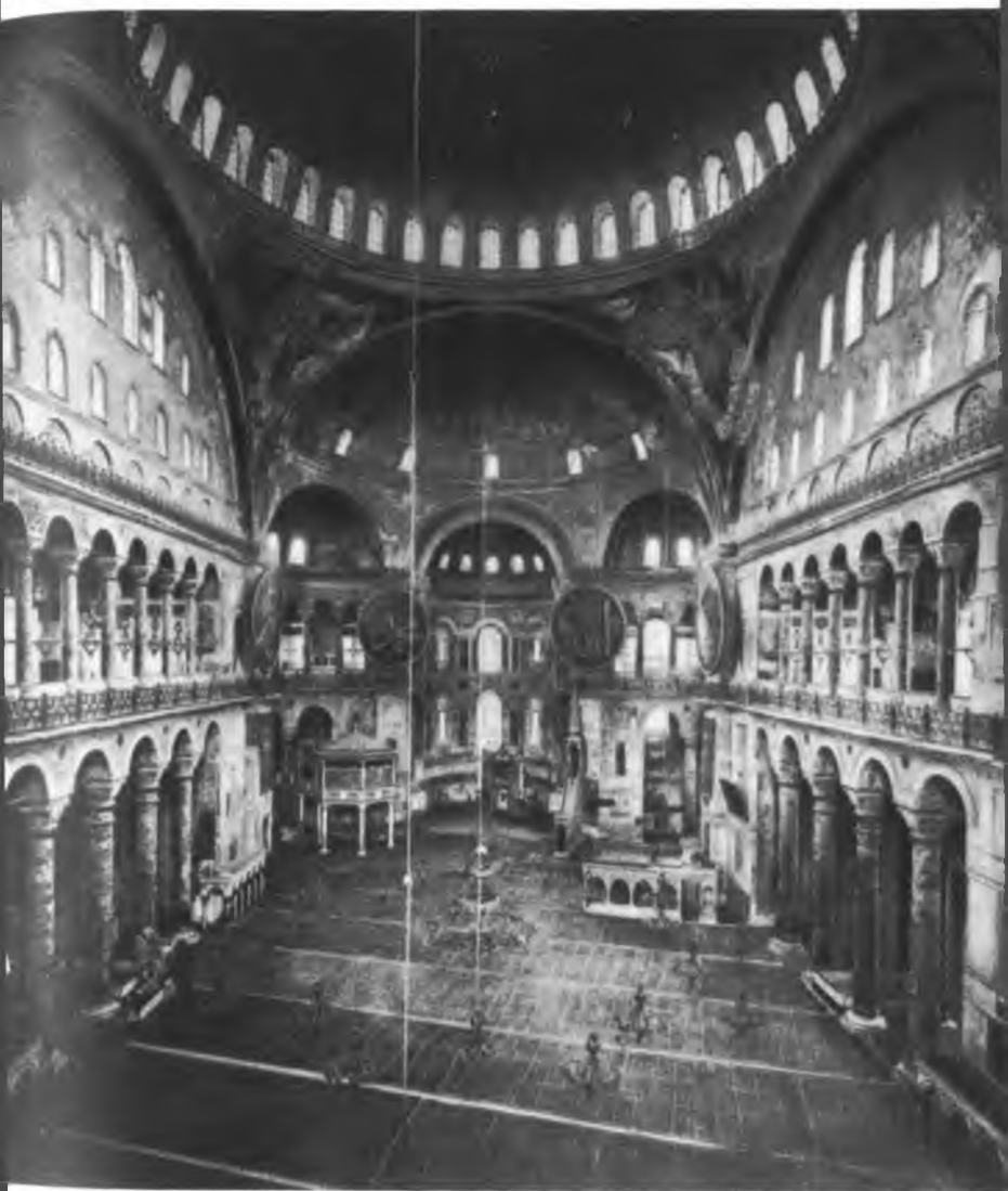
Внутренний вид храма св. Софии