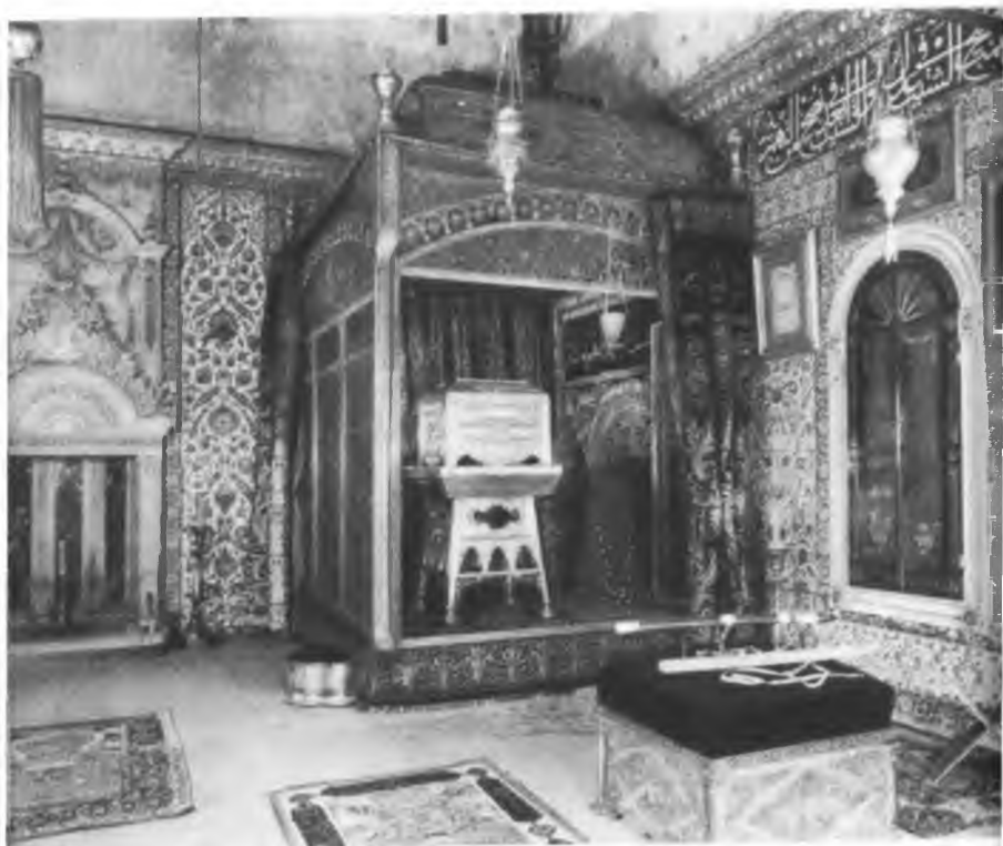
Один из залов дворца-музея Топкапы